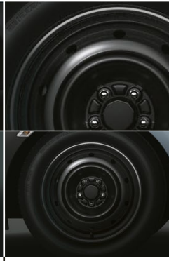
16 インチスチールホイール (センターキャップ付)