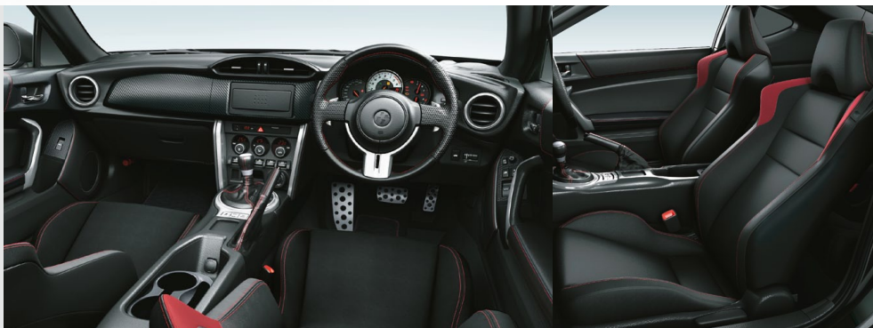
Photo:GT(6AT)。ボディカラーはクリスタルブラックシリカ(D4S)。内装色はブラック。シート表皮はファブリック(高級タイプA)。オーディオレスカバー(1,296円)は販売店オプション(取付費が別途必要です)。