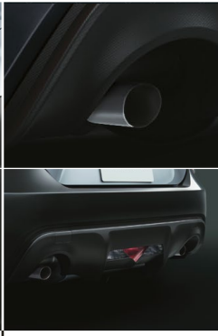
デュアルエキゾースト テールパイプ