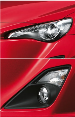
LEDクリアランス付プロジェクター式 デイスチャージヘッドランプ & フロントフォグランプ