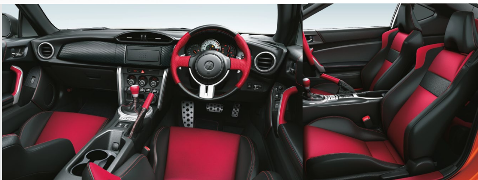
Photo:GT“Limited”(6AT)。ボディカラーはオレンジメタリック(H8R)。内装色のレッドはご注文時に指定が必要です。指定がない場合、内装色はブラックになります。オーディオレスカバー(1,296円)は販売店オプション(取付費が別途必要です)。