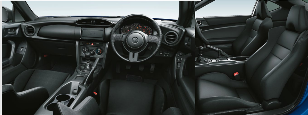
Photo:G(6MT)。ボディカラーはギャラクシーブルーシリカ(E8H)。内装色はブラック。オーディオレスカバー(1,296円)は販売店オプション(取付費が別途必要です)。