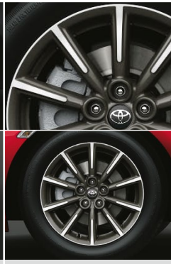
16 インチアルミホイール (センターオーナメント付)