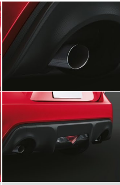
デュアルエキゾースト テールパイプ