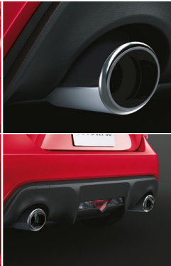
デュアル エキゾーストテールパイプ (マフラーカッター付)