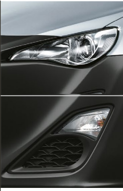
プロジェクター式 ハロゲンヘッドランプ