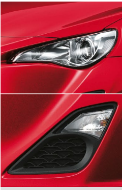
プロジェクター式 ハロゲンヘッドランプ