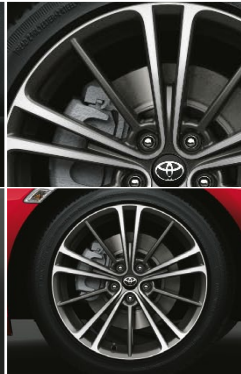
17 インチアルミホイール (センターオーナメント付)