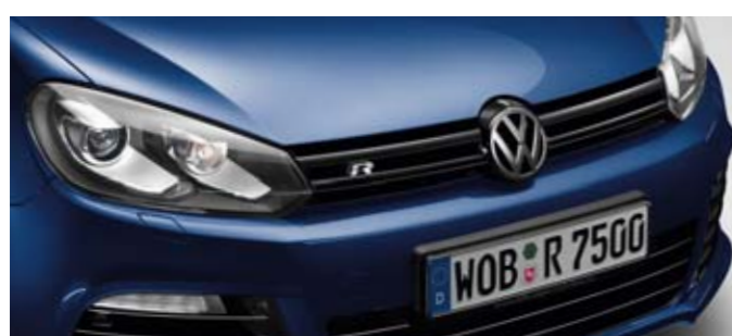
Shadow Blue Metallic-Lackierung P6