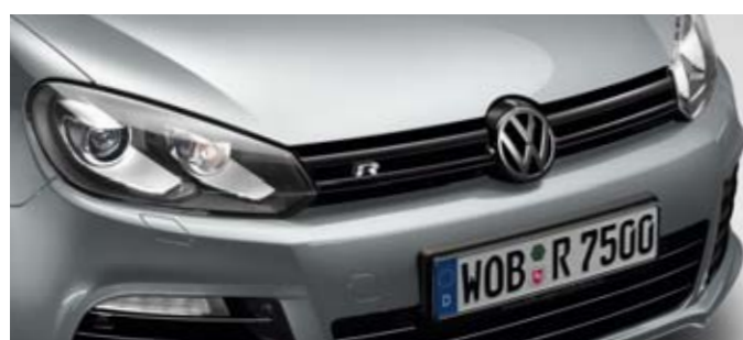
Reflexsilber Metallic-Lackierung 8E