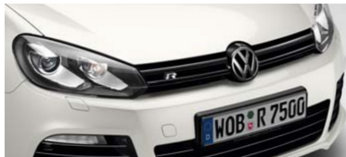
Candy-Weiß Uni-Lackierung B4

Die Entscheidung, welche Farbe am besten zu Ihnen passt, können wir Ihnen natürlich nicht abnehmen. Die Vielfalt macht die Auswahl vielleicht schwer, aber sie ermöglicht es Ihnen auch, Individualität zum Ausdruck zu bringen. Doch egal, für welche Lackierung oder für welchen Sitzbezug Sie sich entscheiden, Brillanz in der Farbe, beste Materialqualität und hervorragende Verarbeitung wählen Sie in jedem Fall.