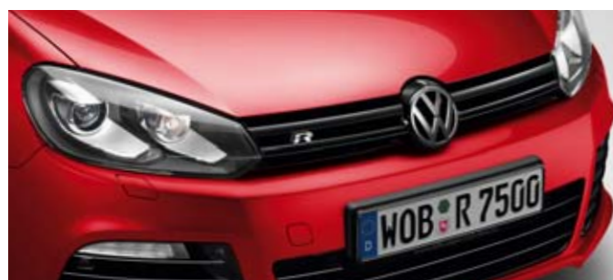
Tornadorot Uni-Lackierung G2