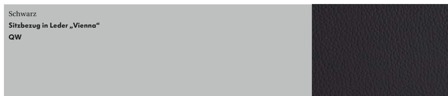
Schwarz Sitzbezug in Leder „Vienna“ QW