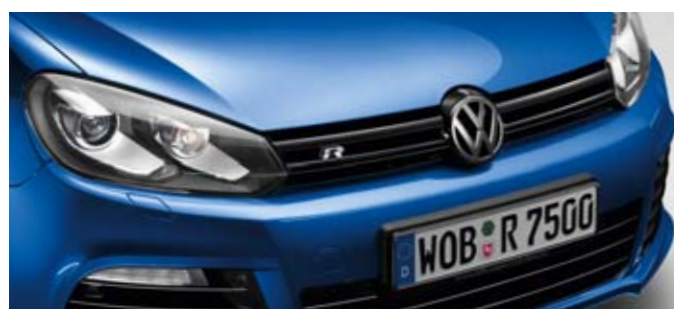
Rising Blue Metallic-Lackierung 4C