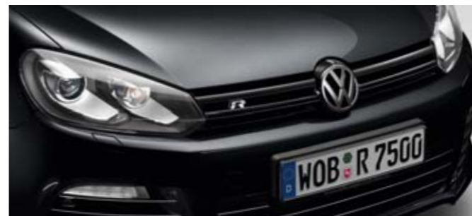
Deep Black Perleffekt-Lackierung 2T