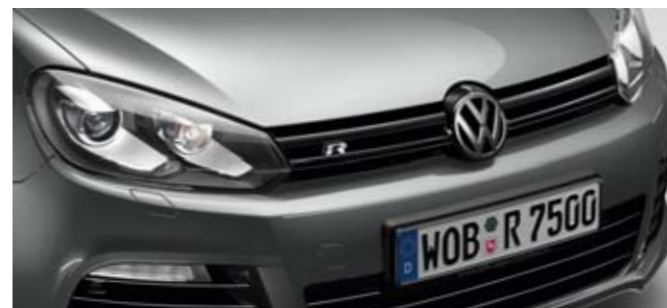
United Grey Metallic-Lackierung X6