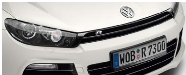
Candy-Weiß Uni-Lackierung B4

Das aufwendige Lackierungsverfahren von Volkswagen wird allerhöchsten Ansprüchen gerecht. Die Basis für einen perfekten Lackauftrag bildet die galvanische Verzinkung als zuverlässiger Korrosionsschutz. Dieser bewahrt Ihr Fahrzeug über dessen gesamte Lebensdauer bestmöglich vor Oxidation – und das bei einer Dicke von weniger als 20 Millionstel Millimetern.