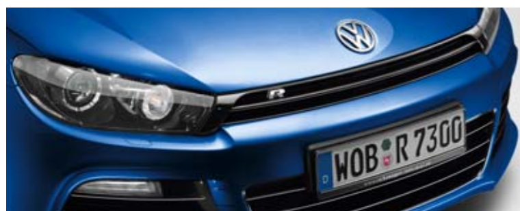
Rising Blue Metallic-Lackierung 4C