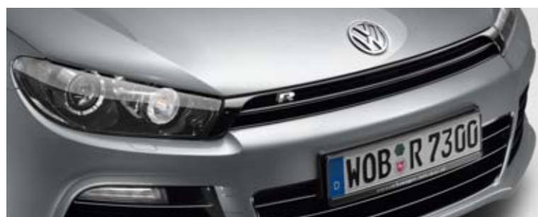
Reflexsilber Metallic-Lackierung 8E