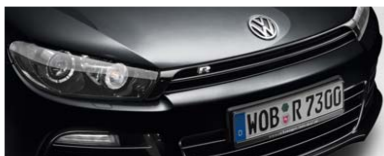
Deep Black Perleffekt-Lackierung 2T