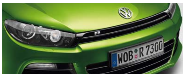
Viperngrün Metallic-Lackierung 6B